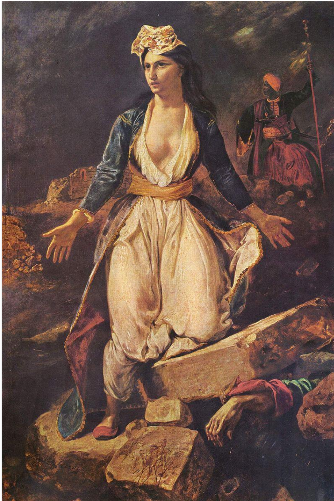
Ευγένιος Ντελακρουά, «Η Ελλάδα ξεψυχά στα Ερείπια του Μεσολογγίου»