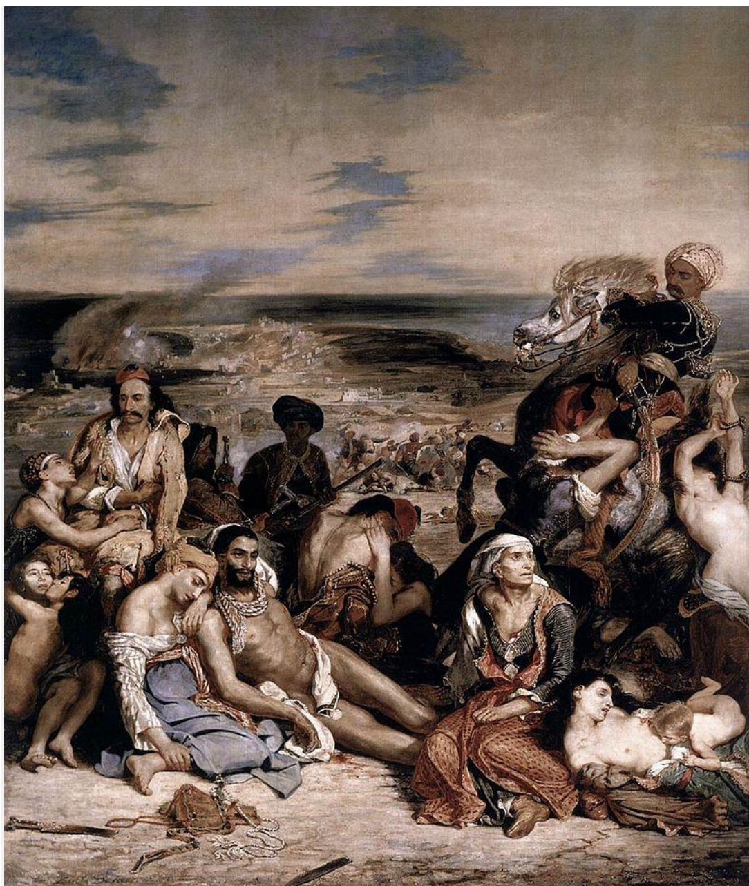
Ευγένιος Ντελακρουά, «Η σφαγή της Χίου»